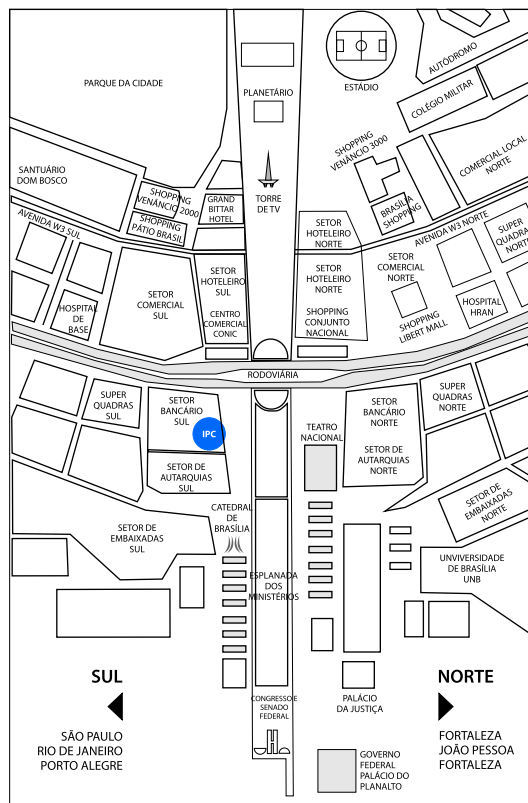
● Centro Internacional de Pobreza

Por exemplo, a missão ao Uzbequistão forneceu um aparato de pesquisas à formulação da Nova Estratégia do Governo para a Melhoria do Bem-Estar Nacional; as missões para El Salvador e Paraguai envolveram pesquisas e avaliação dos programas de transferência condicionada de renda; e as missões para Gana, realizadas em parceria com o DFID, apoiaram a assistência técnica proporcionada pelo Ministério do Desenvolvimento Social e Combate à Fome do Governo do Brasil ao programa de transferência de renda de Gana.